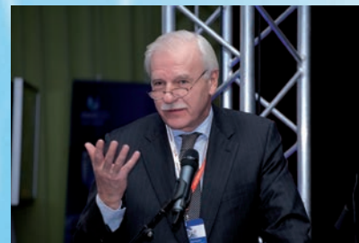
dr Andrzej Olechowski (były Minister Finansów i były Minister Spraw Zagranicznych)