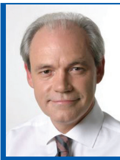
Adam Szejnfeld Poseł na Sejm RP

Od roku 2004 członek Komitetu Regionów w grupie politycznej EPP. Od 2010 roku powołany w skład Prezydium Komitetu Regionów. Uczestniczy w pracach komisji: COTER oraz ENVE. Wyróżniony wieloma nagrodami i odznaczeniami m.in. za działalność na rzecz społeczności lokalnej, osiągnięcia w pracy samorządowej, działania na rzecz zwiększenia atrakcyjności i konkurencyjności województwa na poziomie lokalnym, krajowym i międzynarodowym. Wyróżniony również tytułem „Przyjazny Przedsiębiorcom”.