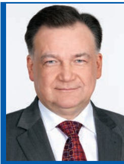
Adam Struzik Marszałek Województwa Mazowieckiego

Adam Krzysztof Struzik, samorządowiec i polityk. Z zawodu lekarz, absolwent Akademii Medycznej w Łodzi. Wieloletni radny, delegat do sejmików samorządowych województwa płockiego i mazowieckiego, a także do Krajowego Sejmiku Samorządu Terytorialnego. Marszałek Senatu w latach 1993-1997. Senator II, III, i IV kadencji.