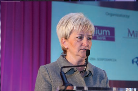
Dorota Ryl, Wicemarszałek Województwa Łódzkiego