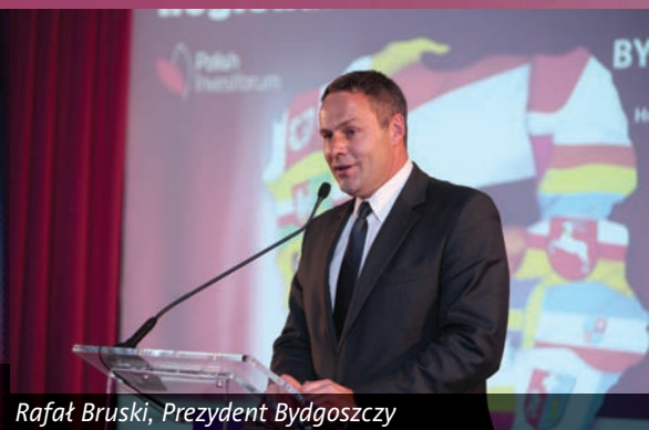
Rafał Bruski , Prezydent Bydgoszczy