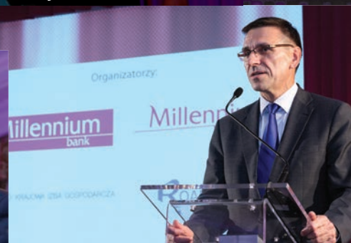
Piotr Grzymowicz, Prezydent Olsztyna