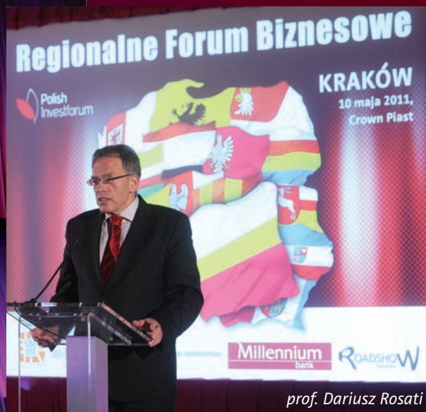
prof. Dariusz Rosati